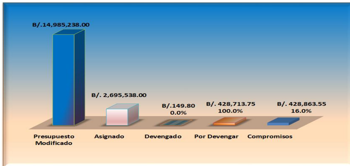
Figura N° 3 Asignado, Devengado, Pagado y Compromiso por Componente Global Del Presupuesto de Inversión