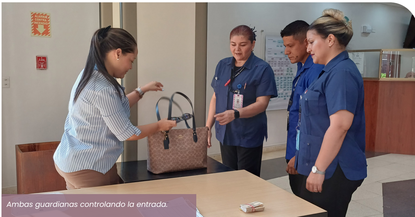
Ambas guardianas controlando la entrada.