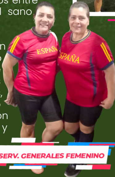
SERV. GENERALES FEMENINO