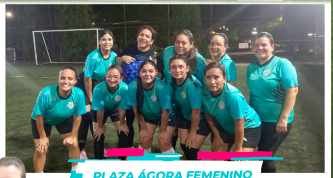
PLAZA ÁGORA FEMENINO

La cita es todos los viernes a partir de las 6:30 p.m. en la cancha "Punto Penal" (detrás del Colegio Artes y Oficios). ¡El equipo de tu oficina te necesita! Invitamos a todos los servidores judiciales a sumarse a esta fiesta deportiva, llenar las gradas y contagiar de energía a nuestros atletas.