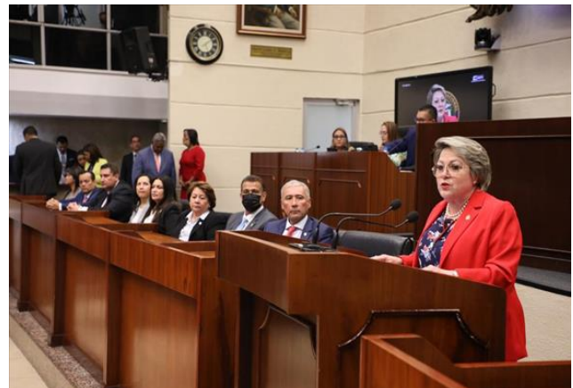
Vista fotográficas del acto de presentación del proyecto de ley que adopta el Código Procesal ante la Asamblea Nacional