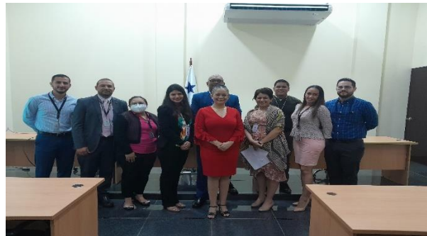
Jornadas de capacitación a funcionarios de los Tribunales Marítimos

Se ha ingresado al SAGJ la cantidad de 56 fallos de la jurisdicción marítima (tribunal piloto) y se brindó capacitación en este Tribunal para el ingreso directo de fallos a SAGJ a partir de 2023.